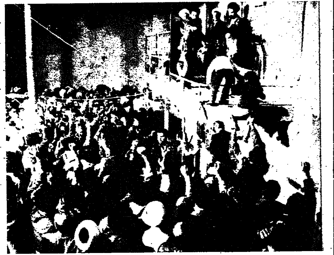
جماهير الشعب الإيراني تستمع الى خطاب آية الله خميني الذي ندد بنظام حكم الرئيس العراقي صدام حسين